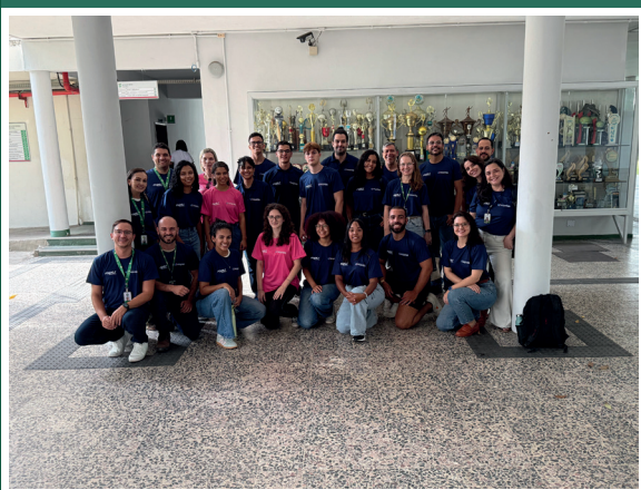
Alunos do Ifes irão realizar a coleta de informações do Cadastro Ambiental das propriedades rurais do Estado

Cadastro Ambiental Rural: cerca de R$ 6 milhões para a execução do projeto Integração do Cadastro Ambiental (IntegrCAR) nas cidades impactadas, com foco na regularização do cadastramento das propriedades rurais do Estado. Em parceria com o Idaf, o IntegrCAR também vai fortalecer o acesso de produtores rurais a políticas públicas, crédito e benefícios fiscais.