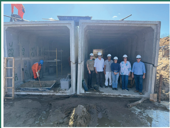
Técnicos da Serd realizarão o monitoramento periódico da intervenção em São Mateus

mitigação dos impactos das inundações recorrentes e melhoria do saneamento e da infraestrutura urbana local. Investimento de R$ 70 milhões.